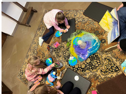
Kinderkatechese in St. Antonius Hofolpe