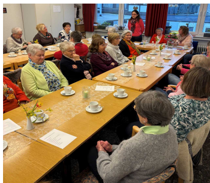
Generalversammlung der kfd Kirchhundem am 14. März